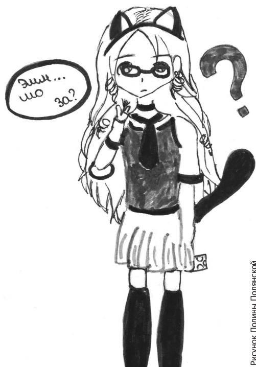
Рисунок Полины Полянской

очень много лестниц, так что я каталась бы по ним вместо того, чтобы ходить. А еще там, наверное, хорошо ездить на гироскутере! Кстати, это на территории Ливадийского дворца разрешают. Но не в здании, а вокруг него.